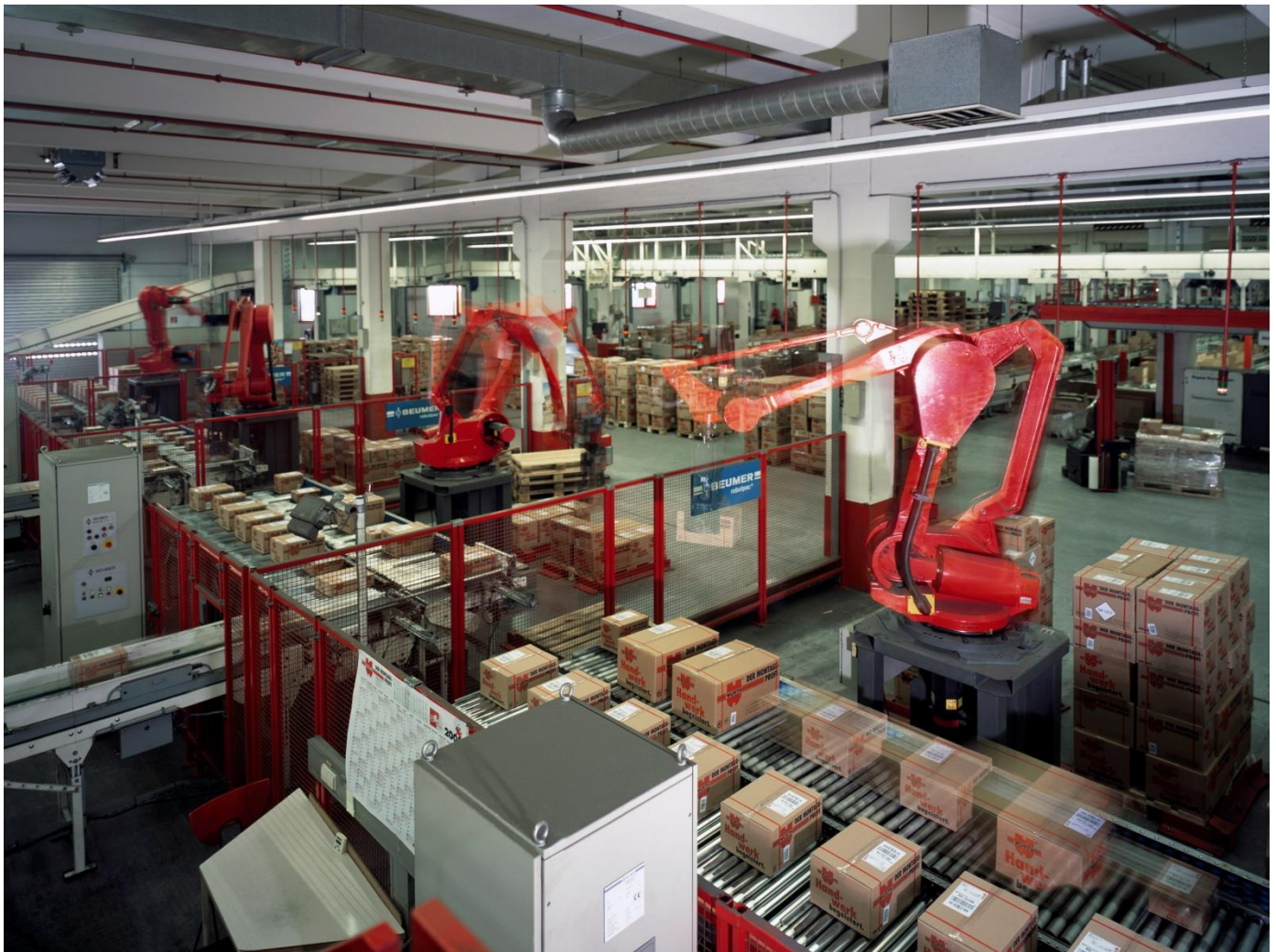
Würth GmbH & Co. KG

Diese Verflechtung von Qualitätsmanagement und Projektabwicklung stellt sicher, dass die Erfahrung aus vorangegangenen Projekten auch tatsächlich in neuen Projekten genutzt wird.