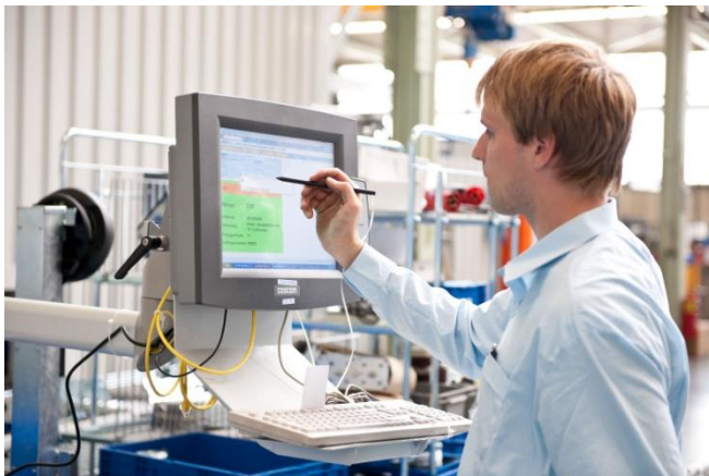
SALT Solutions Implementierung bei der Firma Cloos Schweißtechnik

SALT Solutions ist spezialisiert auf IT-Lösungen und Systemintegration für Produktion, Logistik und Handel. Schwerpunkt ist der Aufbau unternehmenskritischer Lösungen auf Basis von SAP-, Microsoft-, Oracle-, IBM- sowie Java-Technologien und -Plattformen. Wir begleiten Projekte von der Planung über die Implementierung bis zum flächendeckenden, internationalen Rollout und Betrieb.