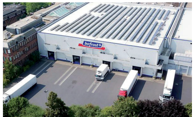
bofrost*Zentrale in Straelen

bofrost* steht seit über 50 Jahren für erstklassige Qualität, herausragenden Service und vor allem individuelle Beratung. Das 1966 gegründete Familienunternehmen mit Hauptsitz in Straelen am Niederrhein ist heute mit 239 Niederlassungen in 13 europäischen Ländern der europäische Marktführer im Direktvertrieb von Eis- und Tiefkühlspezialitäten. Mehr als vier Millionen Kunden, davon rund 2,5 Millionen in Deutschland, wissen die lückenlos geschlossene Tiefkühlkette und