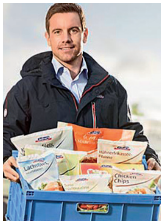
bofrost* bietet ein umfangreiches Sortiment an Tiefkühlkost