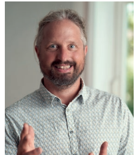
Stefan Moser Process Optimization, Consultancy, Analysis & Training