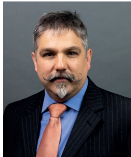
Thomas Michl Forum Agile Verwaltung