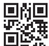
Mehr zur PM Welt